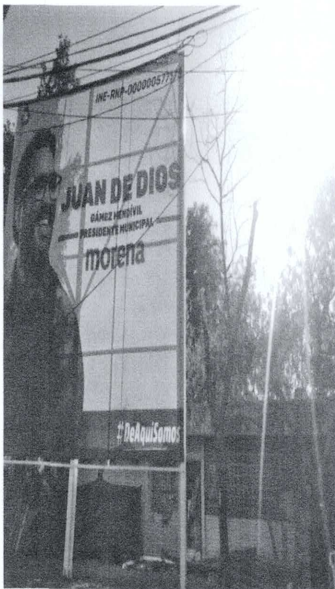
Fotografía número 4.- Se refiere a la propaganda electoral del partido político "morena" y de su candidato a la Presidencia Municipal de Culiacán Juan de Dios Gámez Mendivil, descrita en el punto de hechos número 2, que demuestra la edificación e instalación en la banqueta que circunda la Glorieta Cuauhtémoc, ubicada en la convergencia de la carretera Internacional México 15, en esta ciudad de Culiacán, Sinaloa.